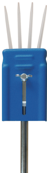
ベアリング給脂用 ニードルノズル GP-NA (805226)