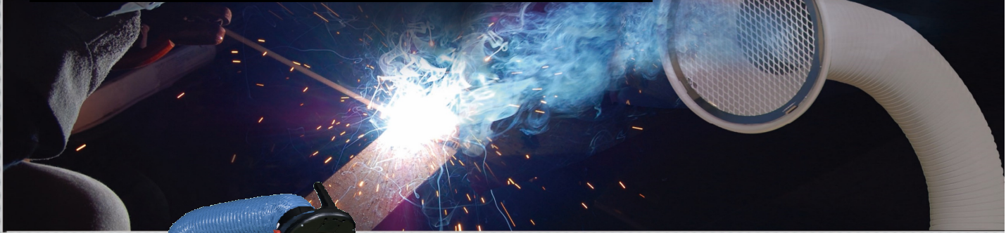
コトヒラ工業の溶接ヒュームコレクター 1.5kWタイプ(KSC-W03)