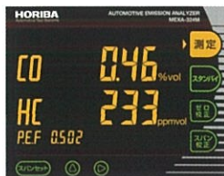
測定 (オレンジ点灯)