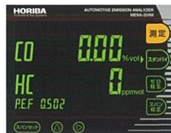
スタンバイ (グリーン点灯)