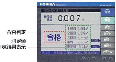
合格判定 測定値 3回平均値測定結果表示