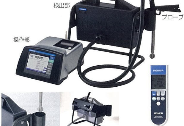
プローブ収納口 ※1 回転可能な検出部 ※1・2 遠隔操作用ワイヤレスリモコン